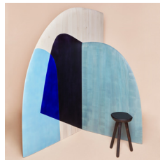
Albane Salmon ébéniste